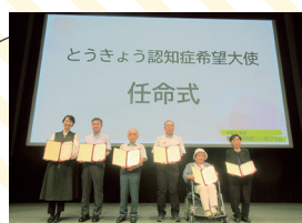
令和5年度の任命式